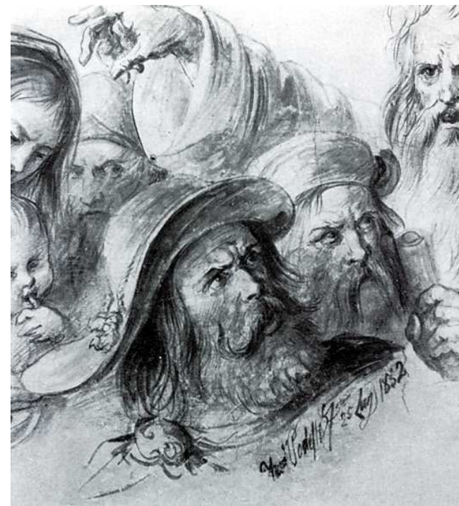
Schizzo per "Il giuramento degli Anconetani"