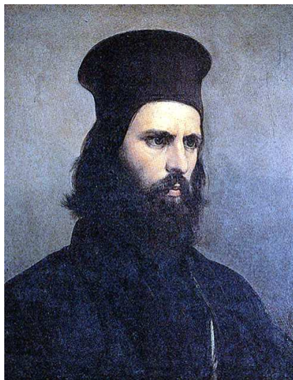
Ritratto di prete ortodosso