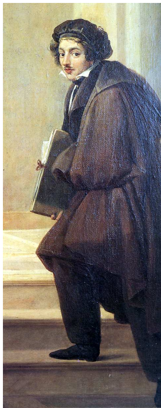
Autoritratto di Francesco Podesti