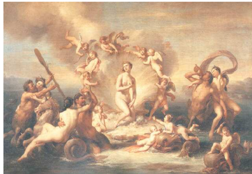
La nascita di Venere